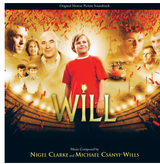
WILL Varese Sarabande