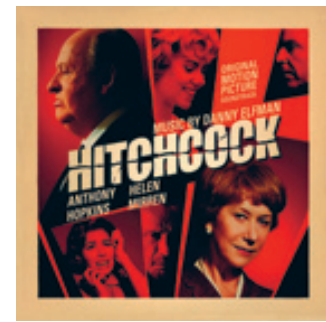
HITCHCOCK Sony Masterworks

Bernard Herrmanns Musik für Alfred Hitchcocks Filme ist ein immer gerne zitiertes Beispiel für die Bedeutung von Filmmusik an sich, ganz besonders sein unverkennbares Geigenmotiv aus Psycho . Hitchcock von Sacha Gervasi erzählt nun mit Starbesetzung die Entstehungsgeschichte von Hichts einflussreichstem Film. Mit der Musik wurde Danny Elfman beauftragt, der schon für Gus Van Sants Eins-zu-eins-Remake von Psycho Herrmanns Musik adaptieren durfte. Bei Hitchcock geht er allerdings ganz andere Wege. Sehr verständlich, schließlich ist das Drama, das hinter der Entstehung des Films steht, ein ganz anderes als das, das in ihm dargestellt wird. Die Gemeinsamkeiten finden sich hauptsächlich in der Orchestrierung. Zwar hat Elfman im Gegensatz zu Herrmann 1960 ein volles Symphonieorchester zur Verfügung, doch ohne dies aufdringlich zu tun, sind auch bei ihm die Streicher Haupttrieb-feder der Spannung. Das Schock-element der Herrmann’schen Streicher umgeht er hingegen vollkommen. Seine Musik hat eine angenehm warme und dennoch zwanghaft dramatisch voranschreitende Qualität, die sich gut anhören lässt und immer die typischen Danny-Elfman-Manierismen durchblitzen lässt, die den Stil dieses Komponisten so ansprechend gestalten.