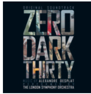
ZERO DARK THIRTY Madison Gate Records

Alexandre Desplat ist schon seit einiger Zeit der Liebling von Hollywoods Top-Regisseuren und dabei ein wahrer Workaholic. Allein acht Soundtracks gingen im vergangenen Jahr auf das Konto des vielseitigen, mehrfach Oscar-nominierten Franzosen, darunter auch der zu Kathryn Bigelows Thriller Zero Dark Thirty um eine CIA-Agentin, die über Jahre hinweg wie besessen das Versteck Osama Bin Ladens aufspürt. Desplat belegt den Film mit einem düsteren Sound-track, in dem sich der Schrecken, der Terror und die Folter, die diese oftmals hoffnungslose Jagd nach einem Phantom widerspiegelt. Der Komponist hat sich über die Jahre einen Stil angeeignet, der in bravouröser Form mit dem Film harmoniert. So ist seine Musik keineswegs überladen und transportiert die Emotionen dabei äußerst effektiv. Insbesondere während des nahezu in Echtzeit dargestellten Showdowns des Films bleibt der Score bemerkenswert neutral, fast schon minimalistisch. Geschickt garniert Alexandre Desplat die Musik zudem mit orientalischem Lokalkolorit, ohne dabei jemals klischeehaft zu klingen. Zero Dark Thirty ist eine Filmmusik, die mit Understatement brilliert – spannungsgeladen, intelligent und dabei reduziert auf das Wesentliche.